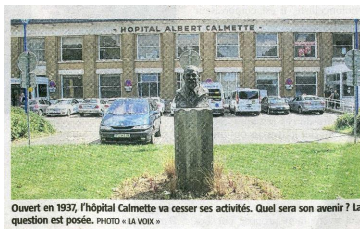
Ouvert en 1937, l'hôpital Calmette va cesser ses activités. Quel sera son avenir ? La question est posée.