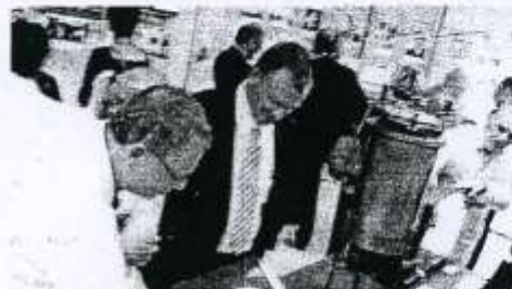
Montée avec le Centre d'histoire locale et le musée hospitalier du CHR, l'exposition en cours n'est qu'un avant-goût des Journées du patrimoine.

De grands noms de la discipline, des appareils d'un autre âge, premières radios... : ce n'est qu'un « apéritif ». Dévoilée pendant l'inauguration des nouveaux équipements, l'exposition sur l'histoire et les progrès de l'imagerie au XX e siècle annonce un événement de taille : la toute première participation du CH Dron aux Journées européennes du patrimoine, en septembre. Pour l'occasion, l'exposition, montée en partenariat avec le Centre d'histoire locale et le musée hospitalier du CHR de Lille sera étoffée.