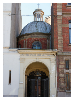
Vue extérieure et vue intérieure de la Chapelle Notre-Dame des Victoires (Association Tourquennoise Elan Culture et Qualité de Vie)