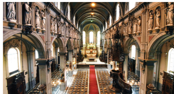
Vue intérieure de la nef centrale (Renaissance Notre-Dame des Anges)

La façade s'élève en triangle, avec un porche surmonté d'un fronton et entouré de 2 fenêtres marquant les bas-côtés. Une flèche est ajoutée au clocher par Charles MAILLARD qui succède à DEWARLEZ en 1850. Le nouvel architecte repense toute la décoration intérieure et propose un riche décor avec une ornementation foisonnante de style néo-renaissance et Second-empire.