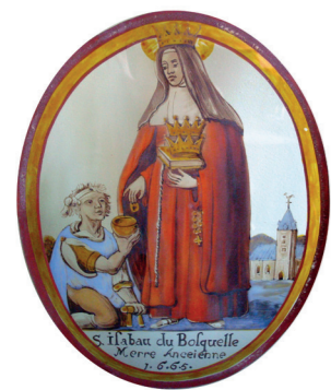
Carton du vitrail représentant Mère Isabeau du Bosquel (Coll. Centre d'Histoire Locale)

En 1630, avec la Contre-réforme et à la demande de l'échevinage, Isabeau de Bosquel et trois sœurs franciscaines arrivent de Comines pour diriger l'établissement, soigner les malades et prendre en charge l'éducation des jeunes filles.