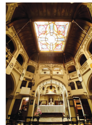
Vue intérieure de la Chapelle du Vœu (Thomas SANCHEZ)

En 1916, les tourquennois font un vœu : si aucun bombardement ne démolit la cité, une chapelle et un couvent seront édifiés en remerciement. En 1921, les architectes J-B et Henri MAILLARD se chargent de leurs constructions. Aujourd'hui encore, les croyants se relaient dans la journée pour prier le Saint-Sacrement.